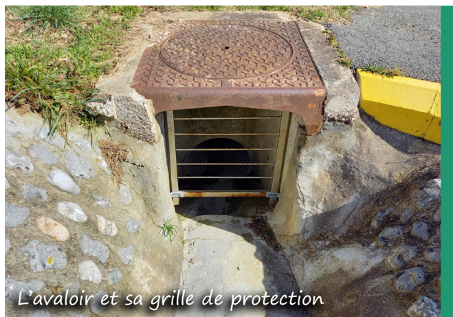
L'avaloir et sa grille de protection

Syndicat du Bassin Versant de l'Yères et de la Côte Animatrice Zones humides Tél. : 02 35 50 61 24 - 06 77 21 60 36 E-mail : f.watroba-smbvyc@orange.fr