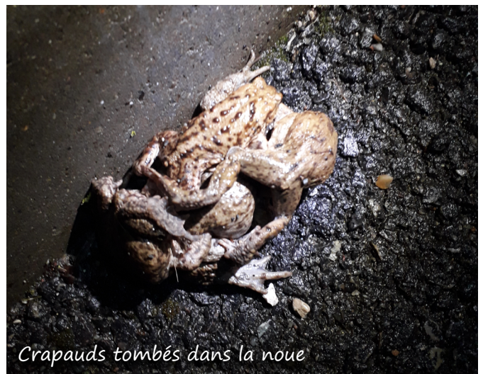
Crapauds tombés dans la noue

Les amphibiens naissent dans une zone humide puis migrent vers un lieu de vie commun à l'âge adulte, leur caractère amphibie leur imposant de disposer de plusieurs types d'habitats. Vers la fin de l'hiver, leur période de reproduction débute et ils migrent à nouveau vers la zone humide pour donner naissance à des têtards. À la fin de la période, tous les amphibiens retournent dans leur lieu de vie où ils jouent un rôle essentiel dans les écosystèmes en tant que prédateurs et proies dans la chaîne alimentaire. Ils sont également considérés comme de précieux indicateurs de la qualité des milieux naturels, notamment aquatiques. En savoir plus : https://www.anbdd.fr/biodiversite/connaissance/les-indicateurs-normands-de-la-biodiversite/amphibiens/